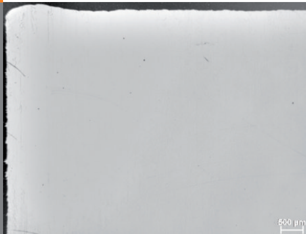
Probekörper (20-fache Vergrößerung)